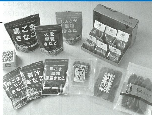
主な商品（健康志向きな粉シリーズ、高品質干しいも、干しいもを使用した焼菓子）

お客様の健康を考えた商品作りを展開し、干しいも、きな粉などに付加価値を加え、美味しく健康に良いもの、より安心安全な商品作りに取り組んでいます。