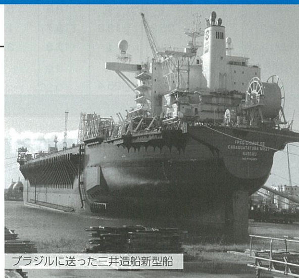
ブラジルに送った三井造船新型船

弊社は、船舶関係の造船制作として設立し、更に大手造船メーカーの取引にて養われた技術により、大手建築分野にも着手し、新規事業分野の開拓に努めて来ました。当社は、【ものづくり】を基盤とする会社として、製造、設計、技術、営業など世界で競争できる価格と技術力のアップを目指して参りたいと思います。